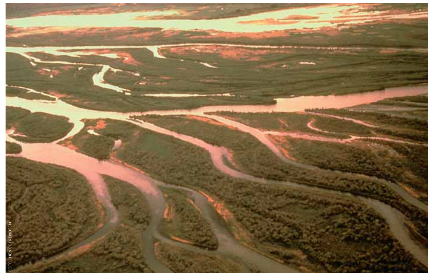
Avulsion belt van de Saskatchewan-rivier in Canada.

In 1931 eiste een avulsie in de Gele Rivier 3,7 miljoen doden.